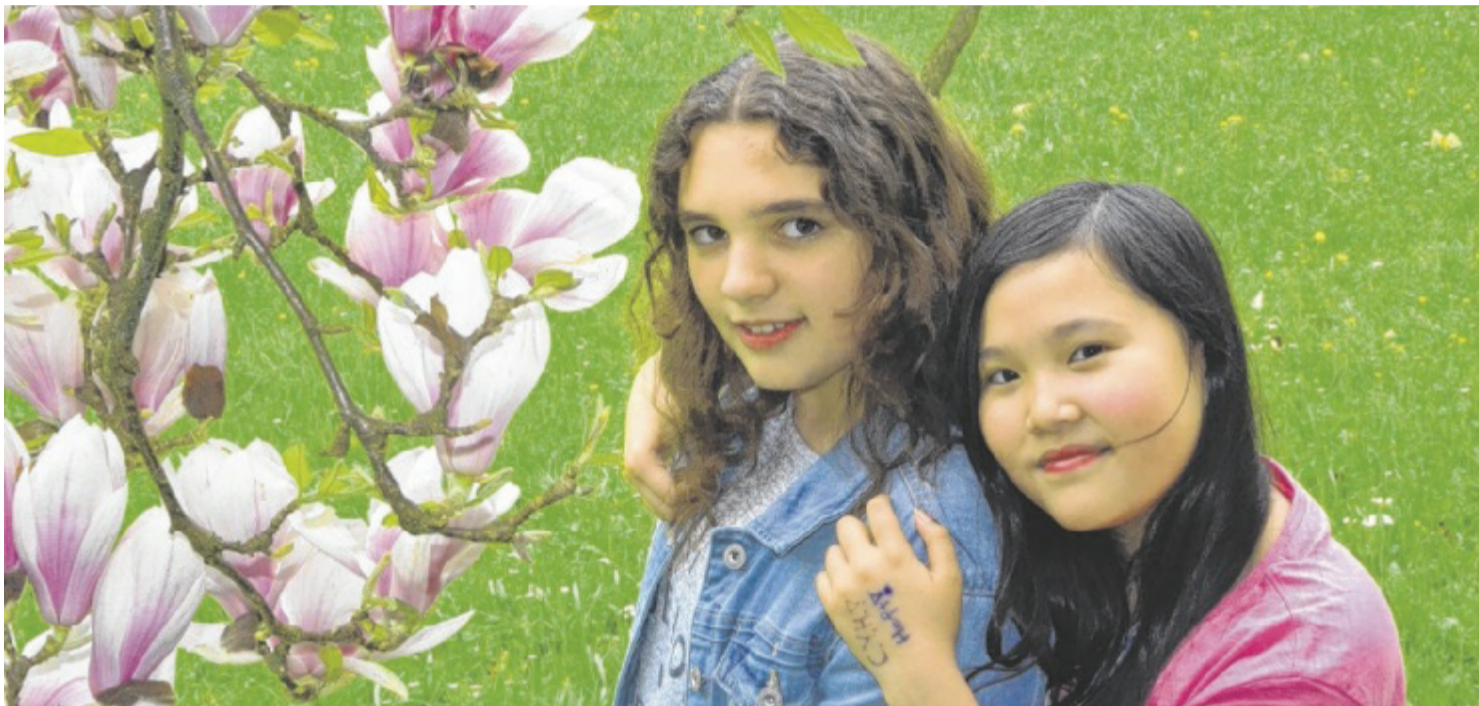
Das Nachmittagsangebot an der NMS 3 ist umfangreich - bei Fotoworkshops entwickeln die Schüler ein Gefühl für Bildkomposition.