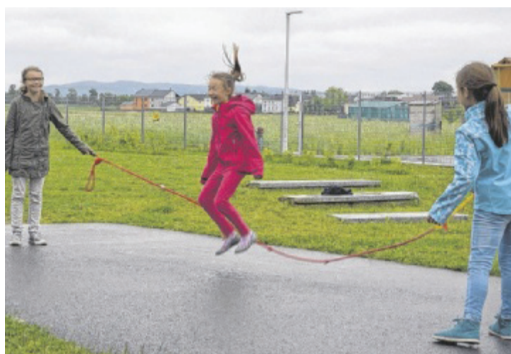
Das ISK bietet in der Volksschule Feldkirchen viele Workshops an.

Jeden Tag von Montag bis Freitag tummeln sich von 11.30 bis 17 Uhr zirka 30 Kinder in der Volksschule. Insgesamt sind auf alle fünf Tage verteilt 55 Kinder zur Nachmittagsbetreuung angemeldet. Die drei Betreuerinnen Gudrun Lang, Susanne Reisinger