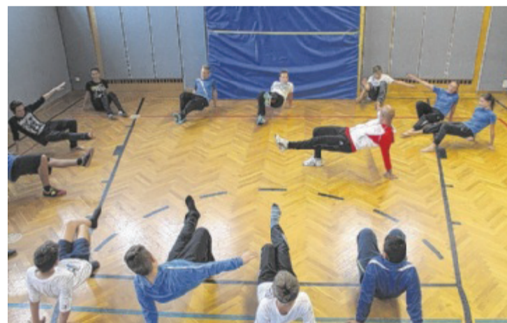
Neben dem Balltraining sind auch Stabilisationsübungen sehr wichtig.