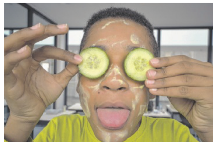
Bei der Erprobung von Gurkenmasken steht der Spaß im Vordergrund.

tenz (ISK) ist ein gemeinnütziger Verein in Linz, der im Jahr 2010 gegründet wurde und im vergangenen Schuljahr 4.000 Schüler in ganz Oberösterreich in der Nachmittagsbetreuung und in Work-