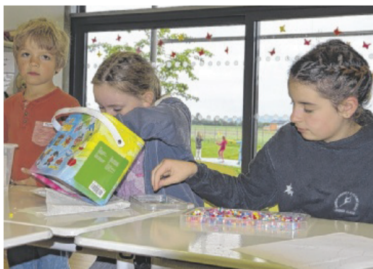
Spielen, Lernen, Basteln und auch Sporteln steht am Nachmittag in der Volksschule Feldkirchen am Programm.