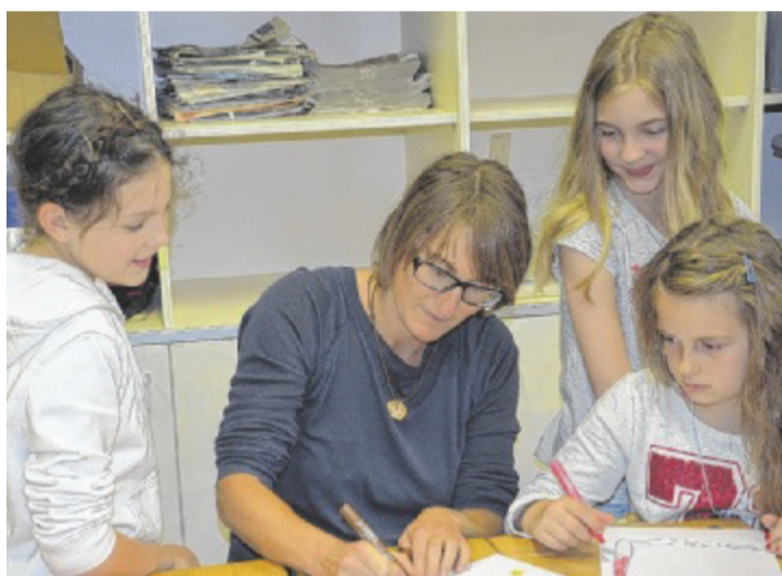
Gemeinsam mit den Kindern gestaltet sie ein interessantes Nachmittagsprogramm in der Volksschule Feldkirchen.

Tips: Was ist das besondere am Angebot des ISK?