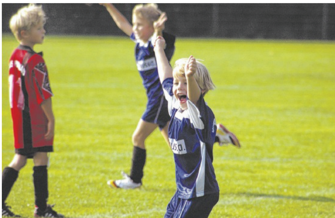
Auf Bewegung kombiniert mit den sozialen Benefits des Teamsports setzt das Fußballtraining der Nabe.