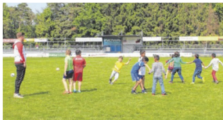
Nachmittägliches Training am Fußballplatz in Marchtrenk