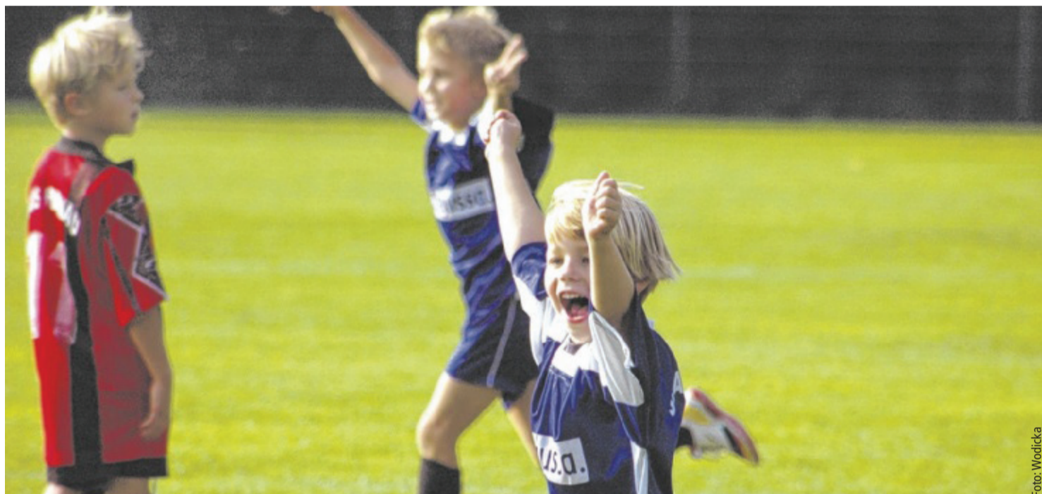
Gemeinsam Fußball spielen und das mit professioneller Anleitung können Schüler im Kick4Life-Projekt, das auch an der NMS Aigen-Schlägl angeboten wird.

Tips – Ausgaben Braunau, Eferding/Grieskirchen, Ried, Rohrbach, Schärding, Urfahr-Umgebung, Vöcklabruck