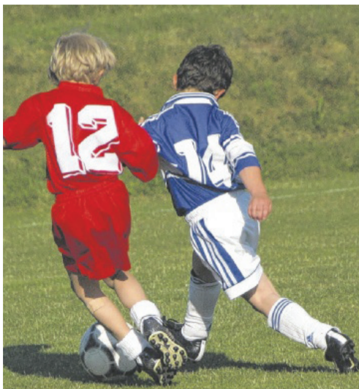
Der Experte weiß: „Bei den Kids grassiert das Fußballfieber.“