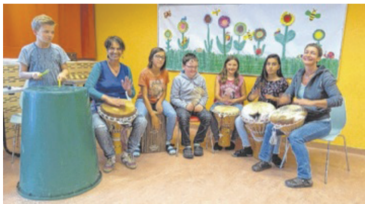
Besonders gut kommen die gemeinsamen Sessions im ISK-Trommelworkshop an.