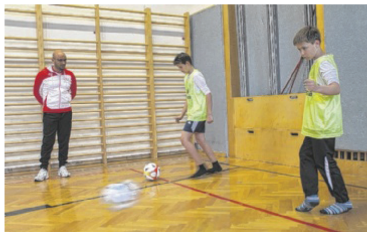
Vor allem die richtige Technik ist beim Fußball entscheidend.

Idealerweise werden koordinative und technische Fähigkeiten in spielerischen Übungen miteinander verbunden und erhöhen somit den Spaßfaktor wie auch die Motivation der Schüler am Fußball. Ebenso gestalten sich gruppendynamische Prozesse nur unter der Mitbeteiligung der Schüler positiv. „Es ist wichtig, die Kinder zur Bewegung zu motivieren, da die aufgestauten Energien so sinnvoll eingesetzt werden“, sagt Genc. ■