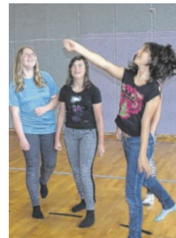
Die bewegte Mittagspause und auch die gegenstandsbezogene Lernbetreuung werden an der Neuen Mittelschule Aigen-Schlägl gut angenommen.