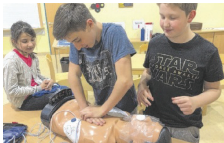
Blitz-Erste-Hilfe-Kurs für die Schüler der Nachmittagsbetreuung.

„Für uns als Schule steht im Vordergrund, dass unsere Kinder ihre Freizeit sinnvoll und möglichst abwechslungsreich gestalten können. Vor allem die Stärkung sozialer Kompetenzen durch spielerisches Erlernen und Erproben halten wir für einen wichtigen Punkt“, sagt Kratky und weiter: „Für dieses Schuljahr haben wir unseren Schwerpunkt im sportlichen Be-