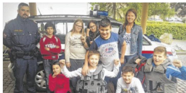
Besuch der Polizei Enns. Die Kinder erhielten Infos zum Alltag eines Polizisten und konnten sich den Dienstwagen sowie die Ausrüstung ansehen.

Die Rückmeldungen der Schüler sind größtenteils sehr positiv. Es ist ganz normal, dass nach langen Schultagen nicht alle Kinder immer gleichermaßen Lust auf Hausaufgaben schreiben oder Lernen haben. „Allerdings stellen unsere gut durchdachten Freizeitangebote oftmals einen Ansporn und eine große Motivation für die Kinder dar, um die Lernzeit effektiv und sinnvoll zu nutzen“, weiß die Be-