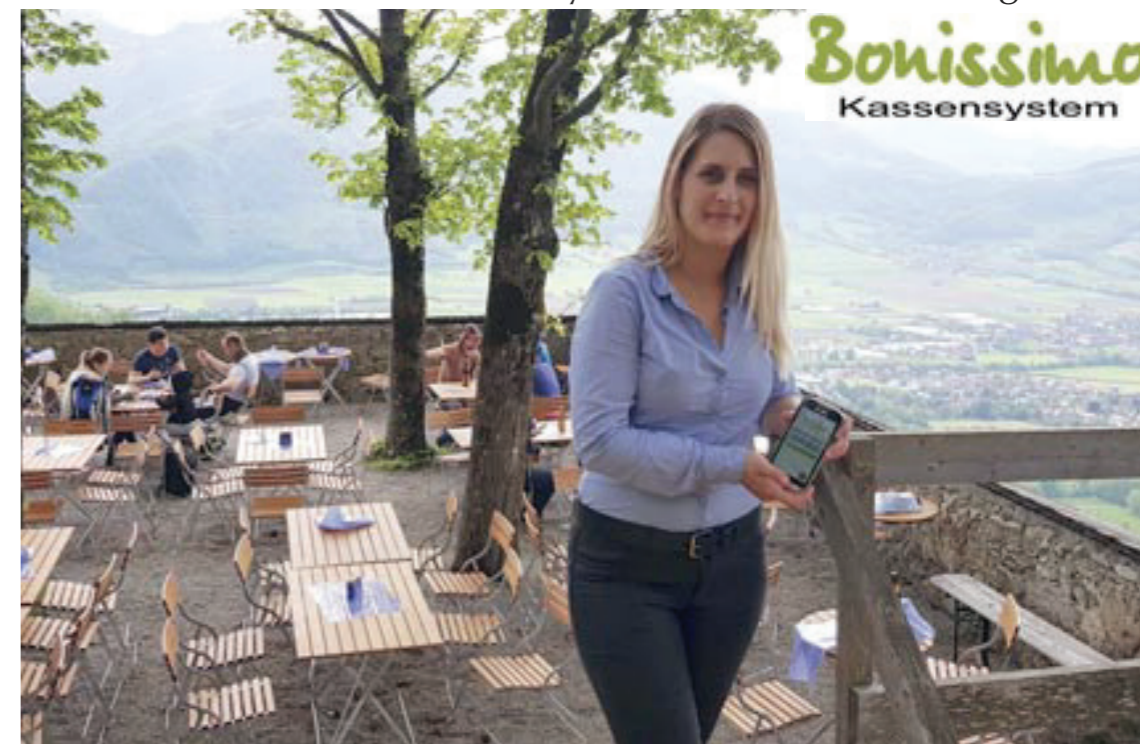
Egal ob auf der Burgterrasse mit herrlichem Ausblick aufs Kremstal, innerhalb der Burg oder bei verschiedenen Outdooraktivitäten – mit dem Kassensystem von Bonissimo haben die Mitarbeiterinnen und Mitarbeiter der Burg Altpernstein bei der Rechnungslegung immer alles fest im Griff.

Diese erfolgreiche, regionale Zusammenarbeit wird nach der Eröffnung für einen reibungslosen Betrieb auf der Burg Altpernstein sorgen und den Gästen entspannte und abwechslungsreiche Freizeitstunden bescheren.