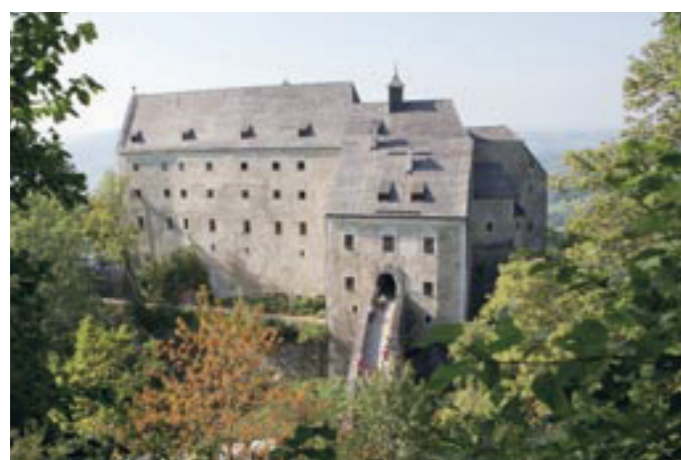
Nach den Sanierungsarbeiten werden rund um das beliebte Ausflugsziel Burg Altpernstein (oben) in der Outdoor-Arena auch Klettern oder Bogenschießen angeboten (Fotos unten).