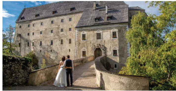
Heiraten auf Burg Altpernstein wird für das Brautpaar zu einem unvergesslichen Erlebnis.

MICHELDORF (sta). Die Wahl einer individuellen Hochzeitslocation liegt im Trend. Paare, die das Besondere suchen, finden dies oft nicht in ihrer Wohngemeinde – aus der Hochzeit wird ein Ausflug oder sogar ein Kurzurlaub. Viele Pfarrer sind bereit, das Brautpaar dabei zu begleiten. Schwieriger wird es, wenn auch die standesamtliche Hochzeit an der Wunsch-Location gefeiert werden soll. Burg Altpernstein und die Gemein-